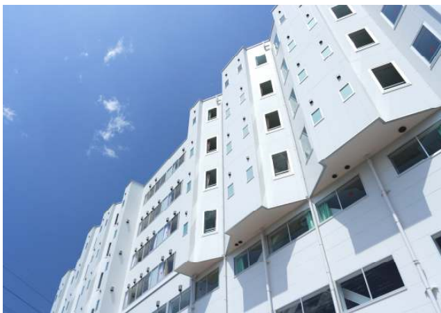
壁を下から見上げると、窓がたくさん配置されているのがわかります。