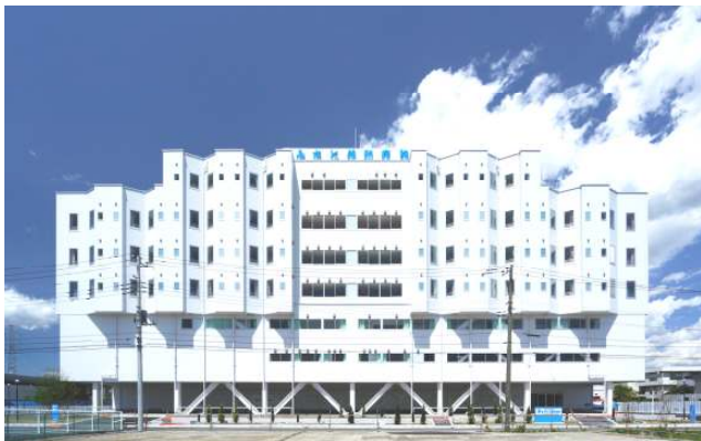
外から見た病院。ちょっと変わった壁面になっています。

ナイチンゲールは戦場の病院で傷ついた兵士を看護したとして知られています。実際には、看護とは何か？を考え発信し、病人にとって必要な環境や病院の管理など幅広く研究し提言を残しています。病院建築についても病人にとって必要な環境について考察を深め、現在も看護教育の場で読み継がれる「看護覚え書」という本に彼女の提言がまとめられています。