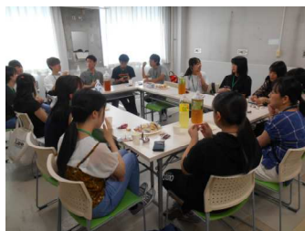
学習会後の交流会