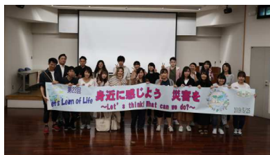
東京にある8つの法人の学生が集まって年一回学習・交流を行います。