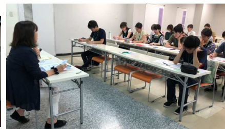
講師による看護講座