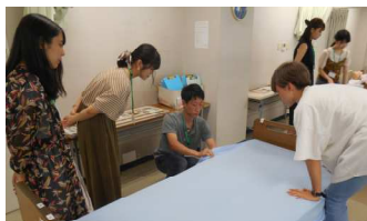
看護講座（シーツ交換）